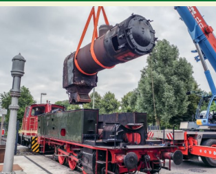
Abheben des Kessels

Sobald der Kessel fertig ist, folgt eine Druckprobe. Nach bestandener Prüfung kann er seinen Platz im Lokrahmen wieder einnehmen. 2024 stehen noch Arbeiten am Fahrwerk und der Antriebsanlage an, bevor das Fahrzeug von einem Sachverständigen abgenommen wird und anschließend wieder den Museumsbetrieb bereichert.