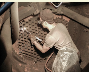
Ausbau der Heizrohre

Die Arbeiten sind schon weit fortgeschritten. Als nächstes werden sämtliche Heizrohre erneuert, die den Kessel durchziehen.